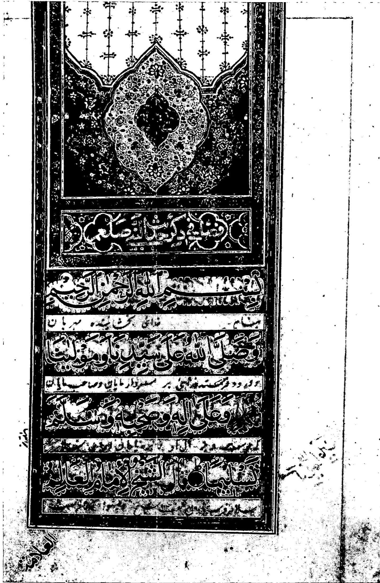
Dalā'il al-hayrāt Arabe 7170