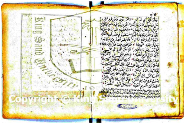
الصفحة ١، ٢، والصفحة الأخيرة من مخطوط "شرح ديوان المنتجب العاني"