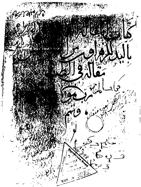
ورقة العنوان من كتاب التصريف للزهراوي