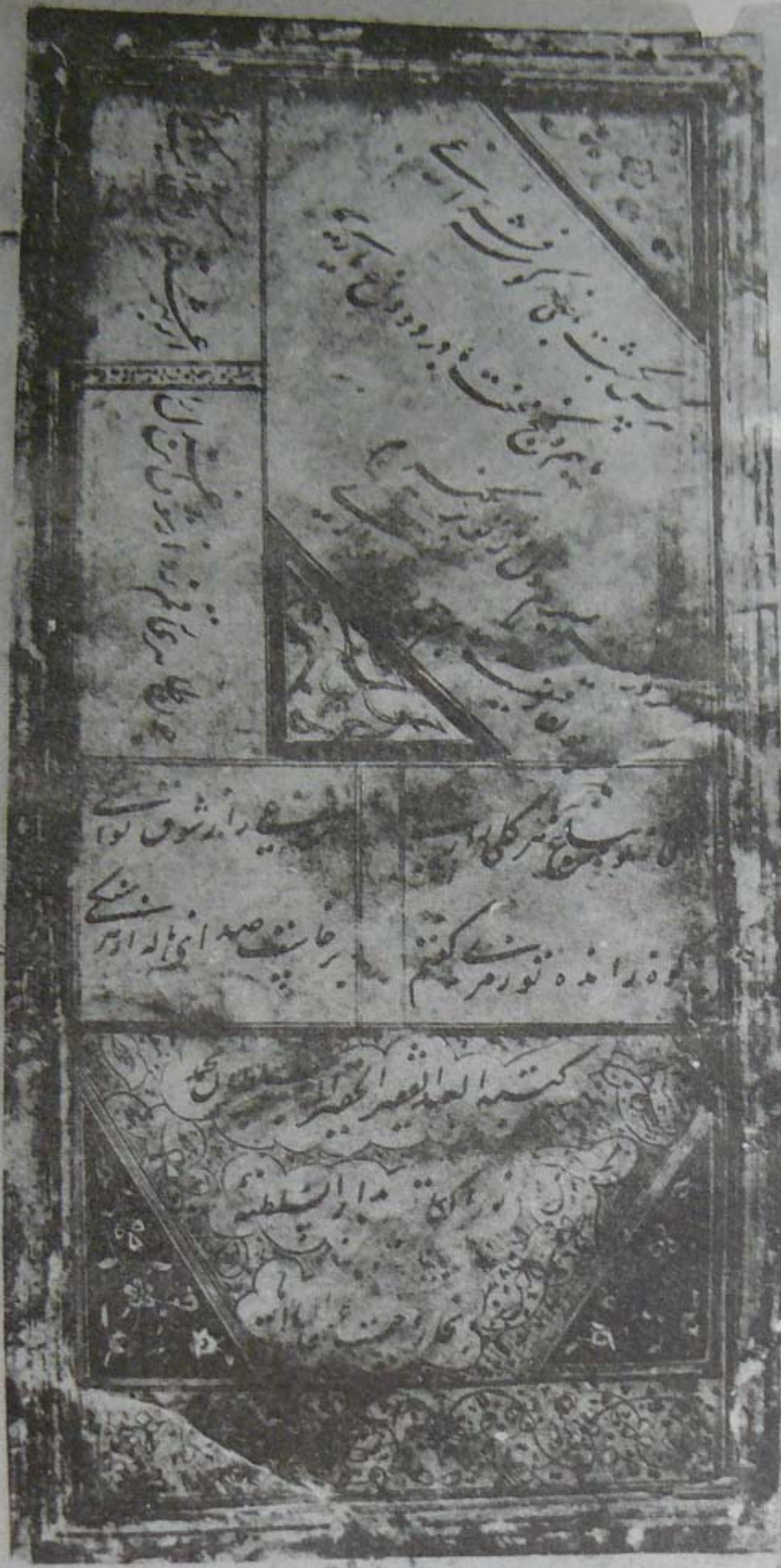
آخرین صفحه چنگ، موزه سالارچنگ، ردیف: ۲۳۲۹