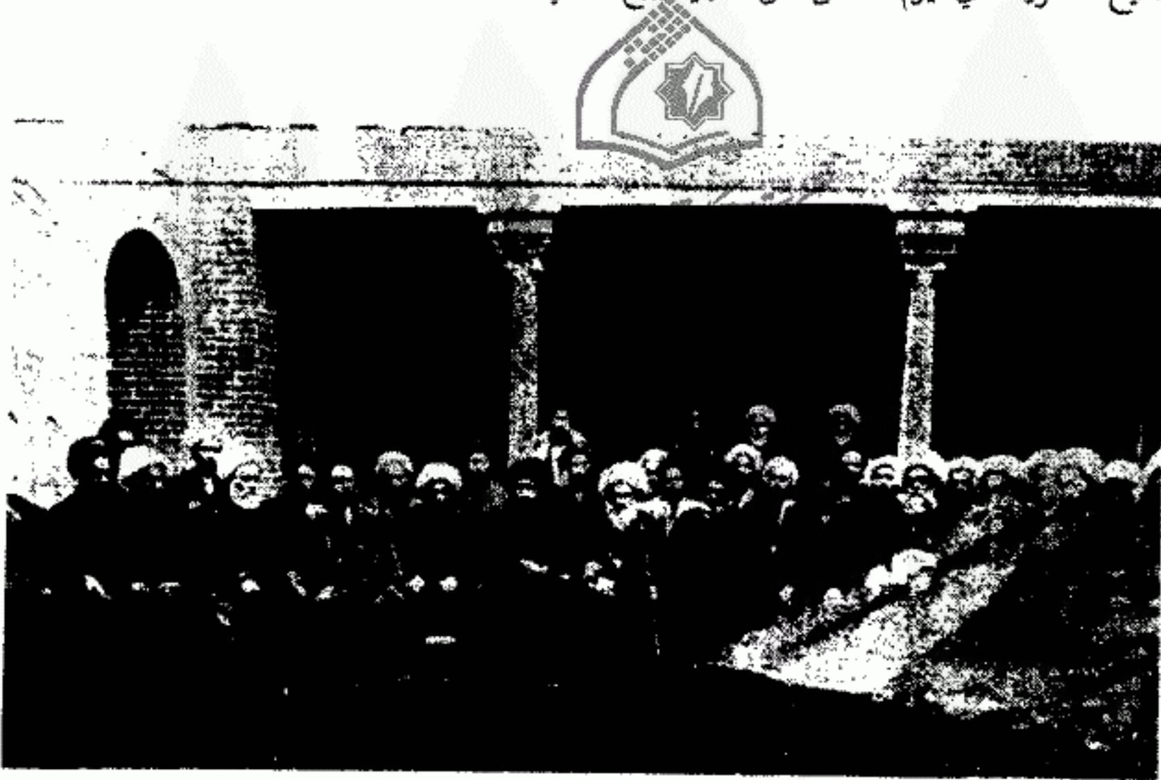
اجتماع علماء النجف وكربلاء والكاظمية (خلال أحداث ثورة العشرين)

وقد افتقدنا في هذه الأيام الشيخ الرباني الشيخ محمد تقي الشيرازي الحائري عشية الأربعاء الليلة الثالثة من شهر ذي الحجة سنة ١٣٣٨ وفقد عماد الشريعة خاتمة العلماء الشيخ فتح الله الشهرستاني في يوم الثامن من شهر ربيع الثاني سنة ١٣٣٩ .